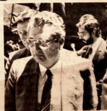
El Fiscal Militar Fernando Torres

La ley de extranjería establece variadas penas por las infracciones a sus normas, dependiendo de las circunstancias. "En este caso hay agravantes, porque se trata de un secuestro", se indicó.