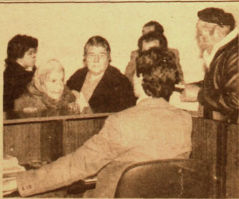
Jubilados se informan de alternativas de pensión.