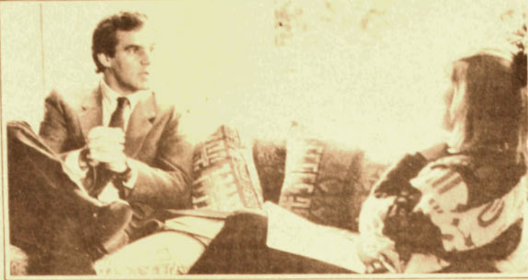
El plebiscito, señala el personero de R.N., le solucionará todos los problemas a la oposición.

R.- El problema crítico de un plebiscito confrontacional como sería con el Presidente Pinochet es que involucra a las FF.AA. Las arrastra y las deja expuestas a los riesgos propios de una elección y enfrentamiento político. Tengo entendido que el plebiscito se pensó para encontrar una ecuación que, incluyendo a los sectores mayoritarios del país y a las FF.AA., diera con un hombre para conducir la nueva etapa política del país, capaz de introducir en la convivencia chilena elementos de pacificación. Un hombre que no implicara aumentar los conflictos internos del país ni su aislamiento internacional. El nombre del Presidente de la