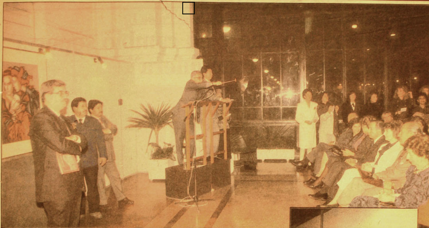
Expectación creó entre el público el remate de la pintura de Carmen Aldunate. Se subastó en primer lugar, y también fue el precio más alto de la noche.