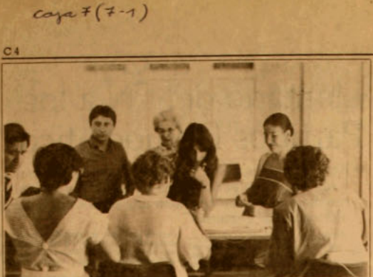
Inscripciones Electorales. — Durante la mañana de ayer siguió la atención de público en los locales del Registro Electoral, en la comuna de Las Condes. Los funcionarios indicaron que la atención se realiza de lunes a sábado, entre las 9 A.M. y las 12 horas. A nivel nacional, más de 120 mil personas han concurrido a realizar el trámite que se efectúa en unos pocos minutos, en las diversas sedes, a lo largo del país.