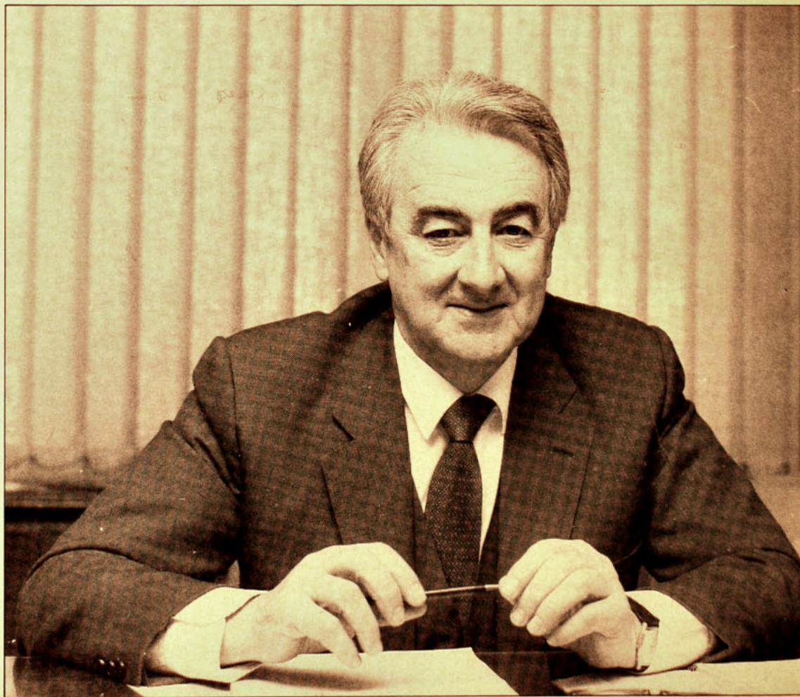
▲ “La permanencia del Presidente Pinochet en la Comandancia en Jefe significa postergar la plena vigencia de la Constitución”.

pando en la comisión conjunta de Renovación Nacional y de la Concertación que presentó la propuesta de reformas constitucionales al gobierno. También hoy se dedica a sus actividades de abogado en una céntrica oficina. Allí “Cosas” tuvo la oportunidad de conversar con él. Un hombre amable, paternal y extremadamente sencillo, que ni siquiera se imagina en un cargo parlamen-