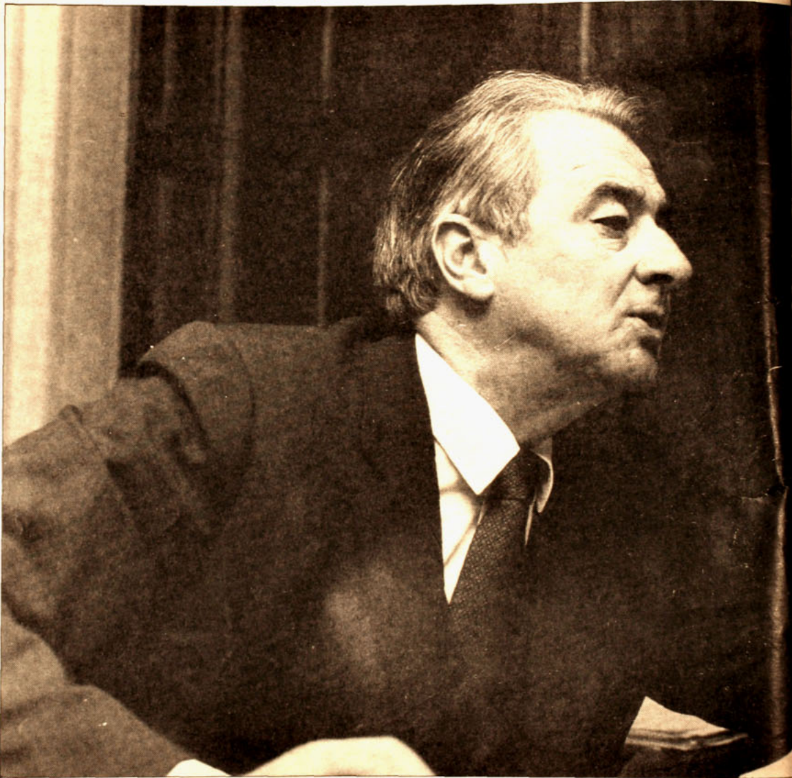
“Confiamos en que la DC tenga un interés real de seguir conversando”.

—Usted ha dicho que Renovación Nacional llama a aquellos chilenos que creen en la economía social de mercado, en el de-